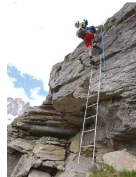
La scaletta durante l'avvicinamento ai bivacchi Pol e Gerard-Grappein.

(possibile neve), per poi salire ripidamente il filo della morena verso le sovrastanti pareti. Una scaletta che poggia alla base su terreno in parte franato e alcuni pioli metallici permettono di superare una paretina verticale. Si continua a salire verso sinistra seguendo la traccia, ometti e segni gialli sempre presenti, in ambiente severo. Si attraversa un colatoio (caduta sassi) per poi risalire uno speroncino con l'aiuto di alcune corde, portandosi verso un tratto più ripido. La salita diventa più impegnativa con qualche roccetta. Si sale prima verso destra fino a individuare una cengia che si segue a sinistra. Si ritorna poi a destra (catene), doppiando lo spigolo fino a raggiungere una valletta. La si attraversa e si sale sul lato destro fino a portarsi in vista dei bivacchi. Con qualche roccetta si raggiunge il Bivacco Pol e in breve il vicino e più confortevole Bivacco Gerard-Grappein (3183 m, 5 h).