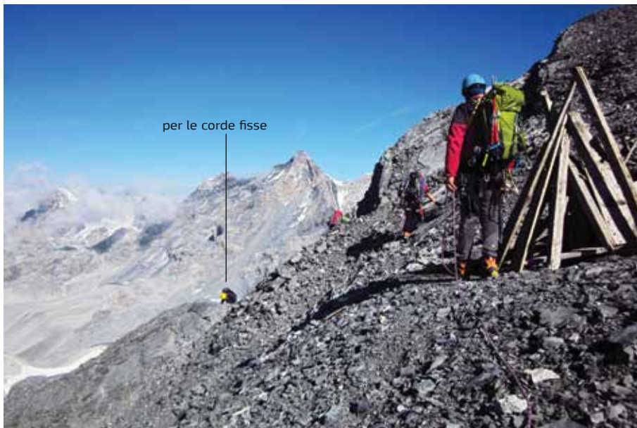
Alla ricerca delle corde fisse per la discesa verso il Rifugio Quinto Alpini.

salita nell'itinerario 17a. È importante in questo caso identificare subito il punto in cui si trovano le corde fisse. Dalla vetta si scendono pochi metri fino a una ben visibile catasta di legni della guerra. Con pochi passi si arriva a una piccola cengia che si affaccia sulla vedretta, da dove si vede più in basso l'inizio delle corde fisse che scendono verso la vallata e il ghiacciaio.