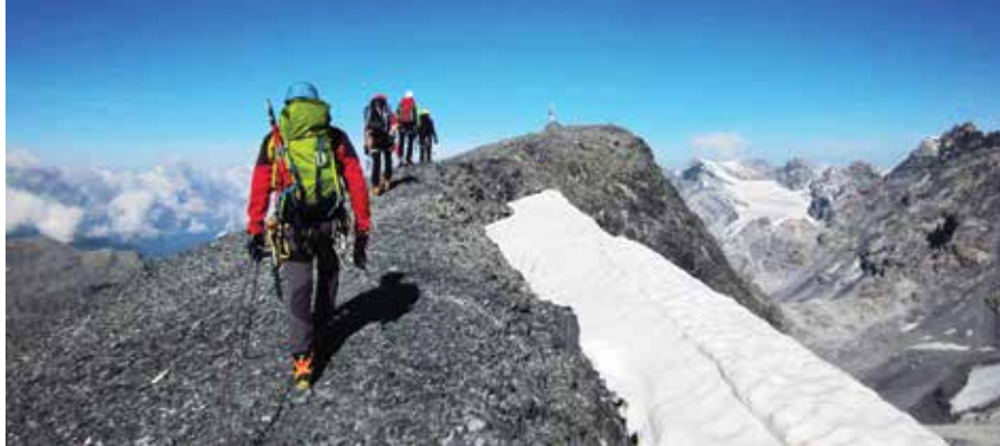
Sulla cima della Miniera.

rendo la quale si arriva senza problemi in vetta dove è posizionata una rudimentale croce di legno (1.30 h).