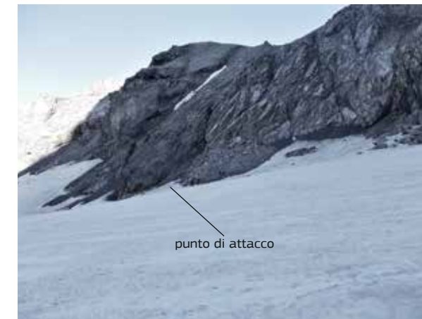
Vedretta della Miniera. Punto di attacco alla cima.