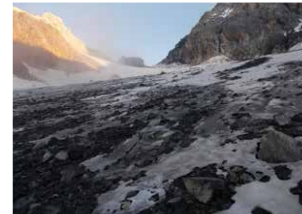
Il Colle delle Pale Rosse.

si trova di fronte verso ovest, perdendo un po' di quota. Ora è indispensabile sapere bene da dove salire, altrimenti la salita può essere davvero problematica. La fotografia può aiutare a trovare il punto di salita. Si sale per una ventina di metri su delicati sfasciumi per trovare una corda fissa che sale in diagonale sulla sinistra per poi curvare e fare un lungo diagonale in salita a destra. Terminata la corda fissa, si piega a sinistra salendo facilmente sulla cresta, percor-