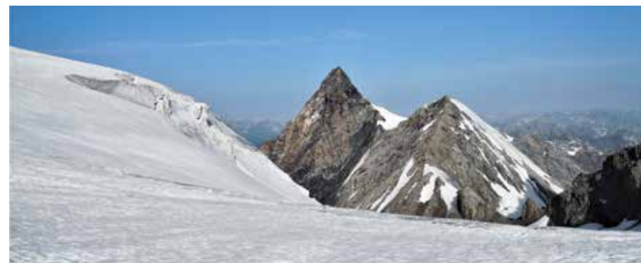
Thurwieser e Gran Cono di Ghiaccio.