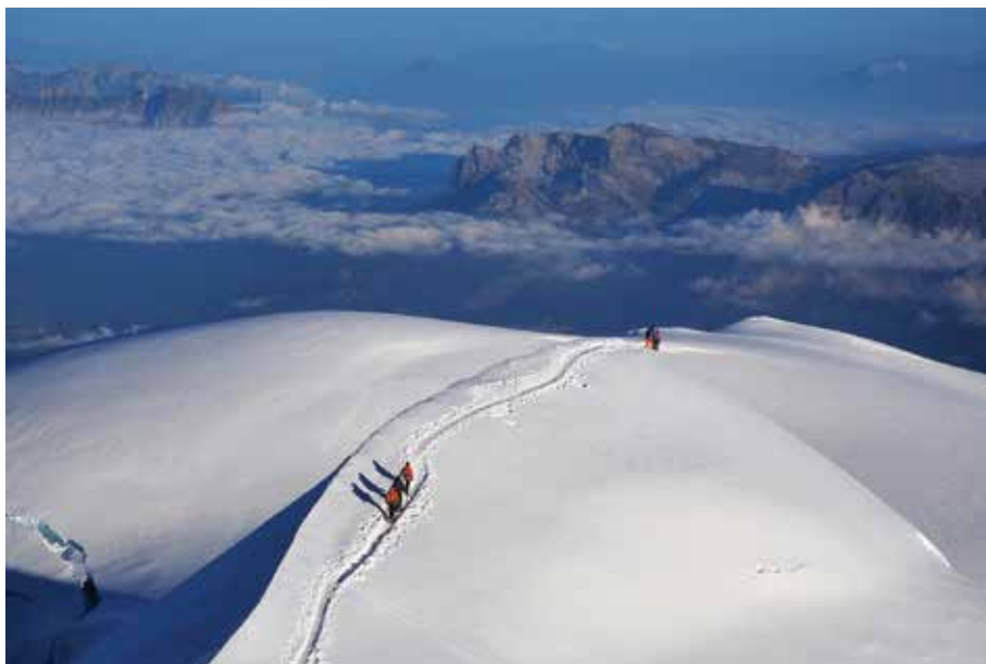
Cordate sulla Grande Bosse.