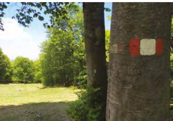
Sella di Botte Donato.