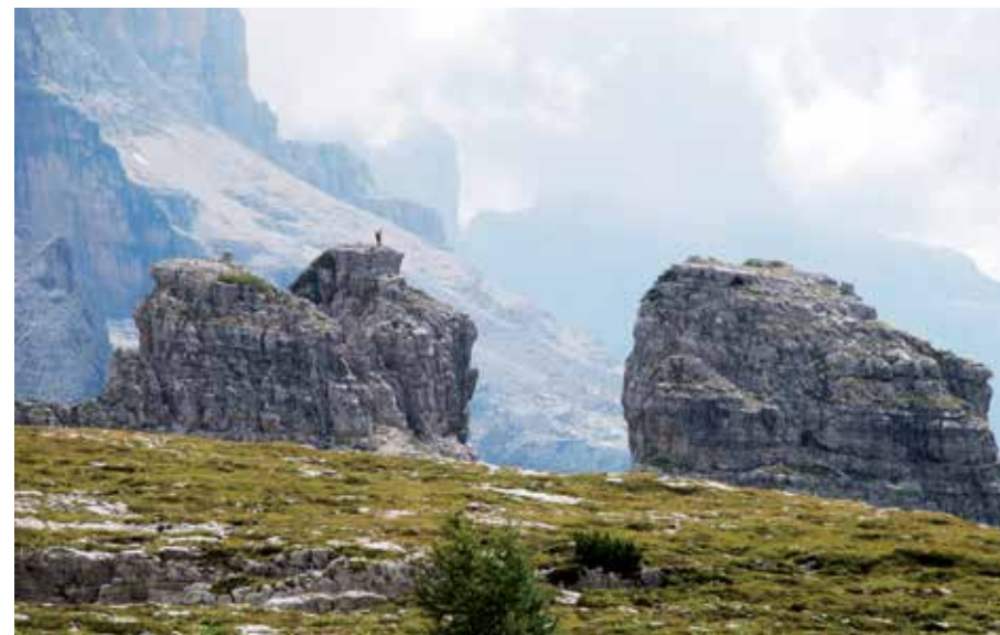
Le cime dei torrioni viste dal Rifugio Graffer

Dalla cima si rientra verso nord per un sentiero che porta al Rif. Graffer.