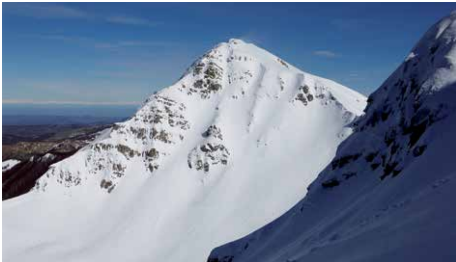
Il Monte Orsaro dalla parete ovest del Braiola