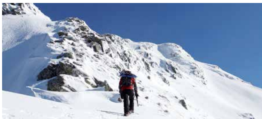
Sulla cresta ovest del Monte Braiola