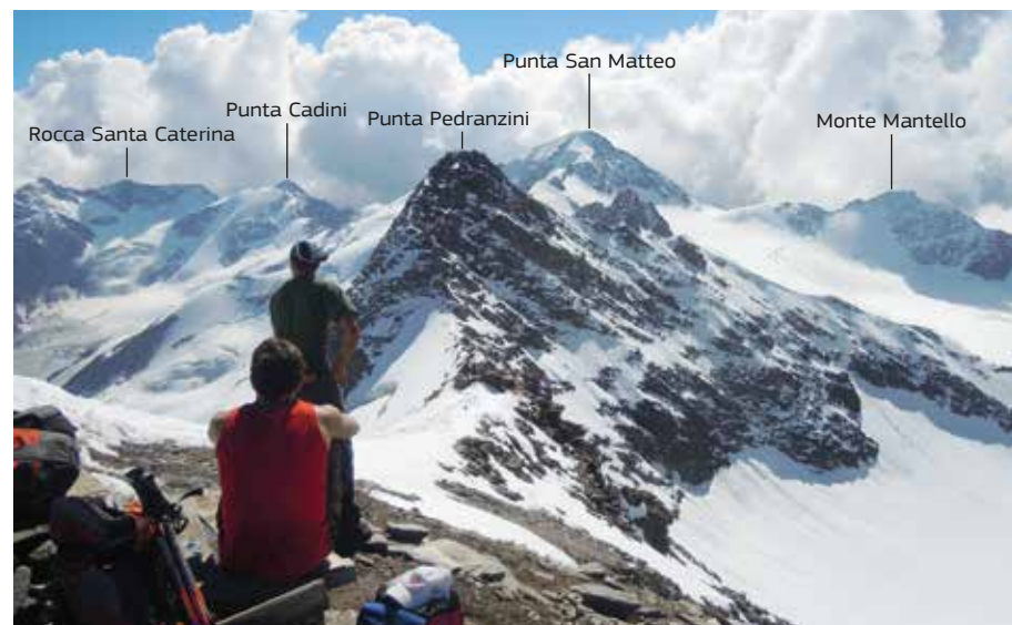
In vetta al Pizzo Tresero. Di fronte Punta Pedranzini.

Dal Rifugio Branca si scende rapidamente al sottostante Lago Rosole e si continua verso sud con il sentiero glaciologico passando per i ponti tibetani fino ad arrivare al torrente che scende dal Canalone dell'Isola Persa, per poi risalirlo fino a entrare nel ghiacciaio. Si entra nel ghiacciaio piegando sulla destra e passando per il Canalone dell'Isola Persa . Si tratta di un corpo roccioso nel mezzo del ghiacciaio, che viene lasciato sulla sinistra. Il ghiacciaio è solitamente crepacciato. Se non ricoperto da neve, i crepacci sono ben visibili e facilmente superabili o aggirabili. Salendo di quota, se c'è neve, il percorso è più insidioso e bisogna capire dove sono localizzati i crepacci. Dopo un tratto di relativa pendenza, si risale il pendio nevoso che porta al Colle San Giacomo , a quota 3240 m (3 h dal rifugio). Da qui inizia la parte più impegnativa del percorso, cioè la salita alla cresta che congiunge Punta Pedranzini con il Pizzo Tresero. Si