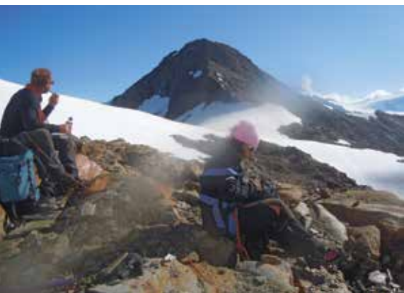
Sosta al Colle San Giacomo, fra il Pizzo Tresero e la Cima San Giacomo.

un percorso panoramico che risale la base del versante nord del Pizzo Tresero e del San Giacomo, passando vicino a testimonianze della guerra, e che rimane in quota fino alla base del Ghiacciaio dei Forni. Da qui passando per i ponti tibetani si arriva al rifugio (2,20 h).