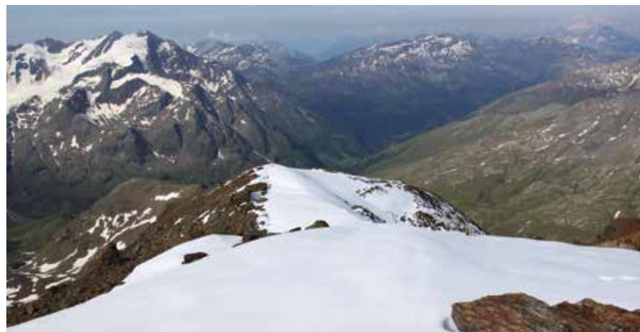
In vetta al Monte Pasquale, guardando verso il Pizzo Tresero.