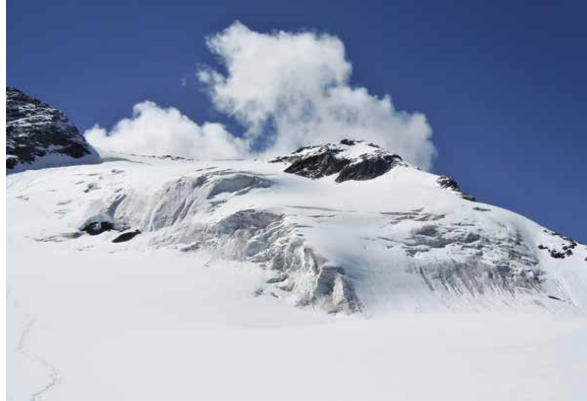
L'ultima parte della salita, rimontando sulla cresta fra la Punta Pedranzini e il Pizzo Tresero.

sale verso sinistra, andando verso la Punta Pedranzini, per evitare le seraccate sovrastanti. La pendenza è sui 35°-40°. Si supera la crepaccia terminale e si piega verso destra, con pendenza più elevata, mirando a metà fra le due cime. Una volta in cresta, girando a destra, si è subito sulla vetta del Pizzo Tresero su cui sorge una grande croce (4 h dal Rifugio Branca).