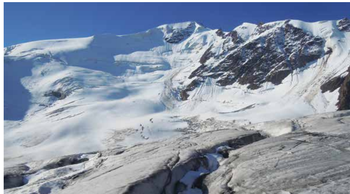
Crepacci salendo sul Ghiacciaio dei Forni. Di fronte la Punta San Matteo.

Dal parcheggio sottostante l' Albero Ghiacciaio dei Forni si prende la strada carrozzabile denominata come sentiero 530 (una volta indicato come 28-28A) che in un'ora di cammino conduce al Rifugio Branca , a 2493 metri di quota, dove si può pernottare in alternativa all'Albero Ghiacciaio dei Forni. È possibile raggiungere il Rifugio Branca anche con il Sentiero Glaciologico Basso (524) che corre lungo il fondovalle seguendo il Torrente Frodofo per poi risalire al Lago Rosole e al rifugio (1,20 h). Oppure si può salire per il Sentiero Glaciologico Alto (520),