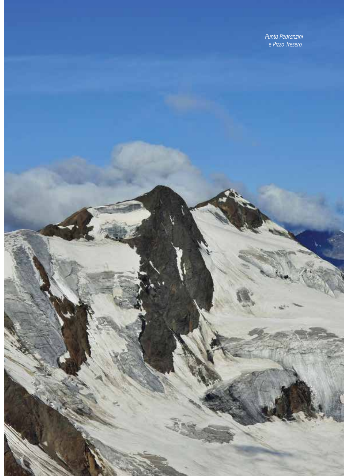
Punta Pedranzini e Pizzo Tresero.