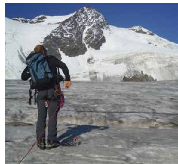
Sul Ghiacciaio dei Forni verso il Pizzo Tresero.

La discesa può essere effettuata per lo stesso itinerario di salita se si vuole rientrare al Rifugio Branca. Oppure dopo aver passato l'Isola Persa, al bordo del ghiacciaio, si prende il sentiero glaciologico 520 e si rientra direttamente al parcheggio sottostante il Rifugio Albergo Ghiacciaio dei Forni.